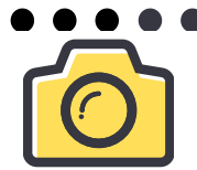
Foto de tu Alimento